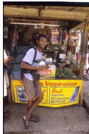
Touriste Israélien Indien

par an, dont beaucoup de jeunes qui séjournèrent à Nariman House à Bombay jusqu'au 26 Novembre 2008. Ce complexe, abritait un centre religieux juif orthodoxe du mouvement loubavitch qui proposait hébergement, prières et restauration kasher aux routards juifs venus du monde entier. Le couple, à la double nationalité israélienne et américaine, qui le