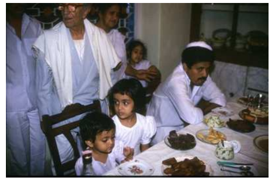
Rupture de jeûne à Kippour

Depuis l'antiquité l'Inde abrite des communautés juives qui ont toujours pu vivre librement en terre indienne et qui contrairement aux autres diasporas n'ont jamais été victimes de persécutions excepté durant la période portugaise.