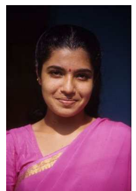
Jeune fille de la communauté juive

Leur décision n'était pas une tâche facile. Elle s'est développée sur une longue histoire de l'activité sioniste et de l'idéalisme, tel qu'il est exprimé dans cette chanson Malayalam (langue parlée au Kerala) au début du 20 ème siècle composée par Isaac Mosheh Roby: